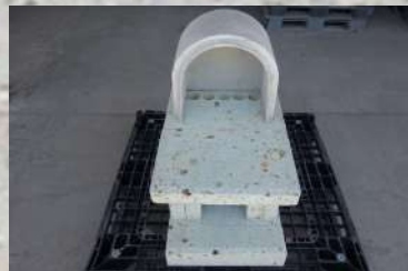
⑥ドーム型の後ろ部分を組む