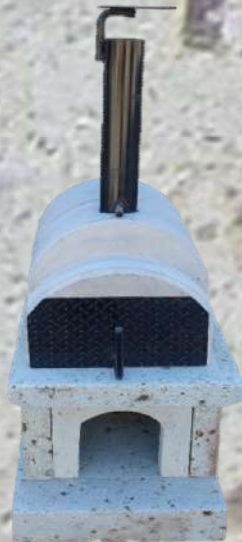
⑫煙突を入れて完成