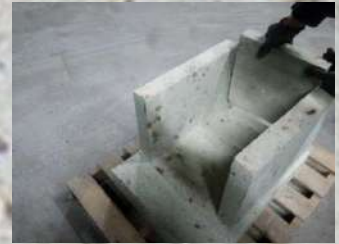
②縦板・後方板を組む