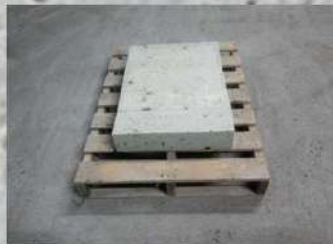
①土台石を3本並べる