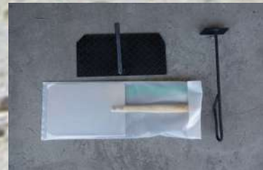
蓋・ピール・灰カキもついてます！