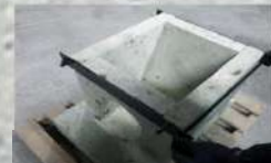
④押さえ金具を取り付ける。2人で行うと簡単です。