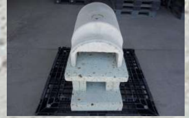
⑪ドーム型の前部分を組む