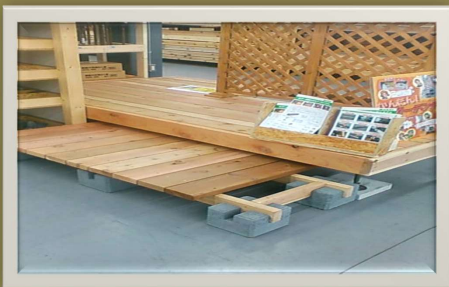
・簡単に組み立てた様子